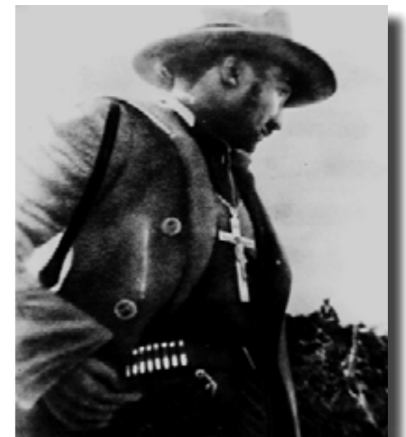
Fotografía del General Enrique Gorostieta

Si revisamos la historia, descubriremos que en la mayoría de las insurrecciones conservadoras, el alto clero ha tenido que tomar partido por los reaccionarios, ofreciéndoles su apoyo moral o material; y en consecuencia, valorando el ser recíproco con sus defensores en términos de un regalismo tendiente a vulnerar, a futuro, la autonomía de la Iglesia; en otro escenario, los mitrados han tenido que lidiar también con la posibilidad de tutelar, teocráticamente, a la clase gobernante emergida del triunfo de las armas confesionales. Así ocurrió en la Guerra de Reforma y décadas después en la Cristiada; en el primero de estos conflictos, la alta jerarquía, al verse amenazada por sus enemigos, esperó, como ella sabe hacerlo, a que esa minoría católica activa se alzara en contra de las fuerzas anticlericales. En el segundo, consintió de comienzo que los católicos militares tomaran las