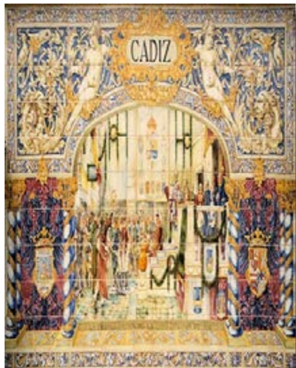
Mosaico alegórico al juramento de la Constitución de Cádiz

El mérito de Iturbide residió en resucitar el movimiento independentista cuando éste se encontraba prácticamente en la lona y sin esperanza