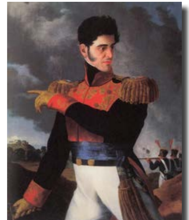
Virrey Juan Ruiz de Apodaca Conde del Venadito

Esta libertad que por fin creían alcanzar los presbíteros mexicanos gracias a Iturbide y al Plan de Iguala poco les duró; antes de lo previsto y