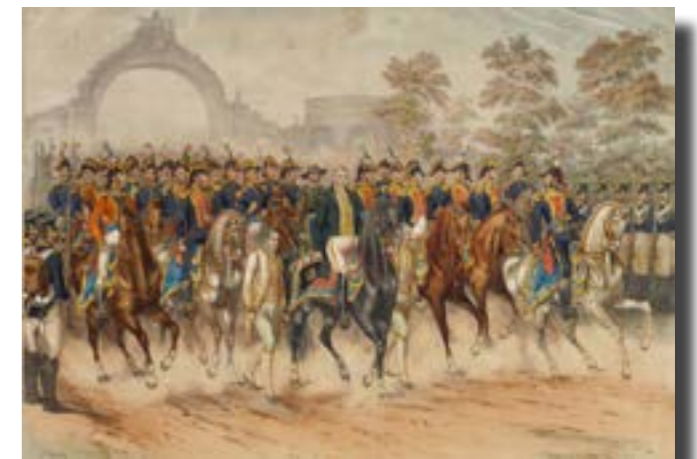
El ejército trigarante encabezado por Agustín de Iturbide

En un balance final, el tipo de monarquía propuesta por los iturbidistas resultaba moderadamente democrática y liberal, dentro de lo permitido en un sistema dinástico o regio; este carácter moderno y progresista se lo debió a las ideas liberales que pretendió rescatar o retomar