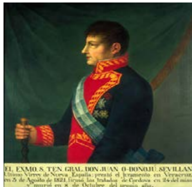
Último virrey de la Nueva España Don Juan de O'Donojú

soldados de Cristo rey, los cristeros. Continuando con la etapa iturbidista. Ante el riesgo de una posible declaración de Independencia, más que nunca las Cortes españolas necesitaban de su lado