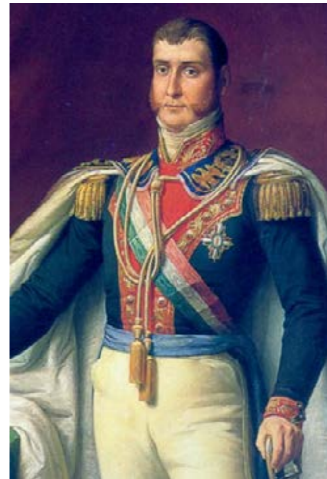
Retrato de Agustín de Iturbide portando insignias imperiales

Don Agustín de Iturbide era hijo de emigrantes vascos y de ancestros nobles. Nació en Valladolid, capital de la provincia del mismo nombre. Militar de profesión, perfeccionó sus conocimientos y habilidades militares combatiendo a los insurgentes. El virrey Félix María Calleja lo ascendió al grado de coronel y le asignó el batallón de Celaya de reciente creación. Con el batallón le otorgó también el mando militar supremo de la provincia de Guanajuato.