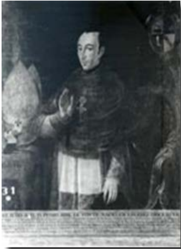
Firma de los Tratados de Córdoba

osadía, lo enemistó y enfrentó con la Iglesia y junto con ella con todos sus defensores. La controversia y