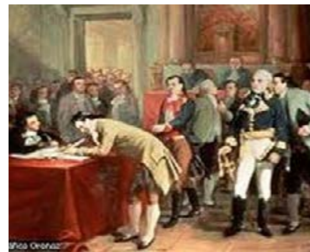
Firma de los Tratados de Córdoba

Ocho meses transcurrieron para que el Presidente de