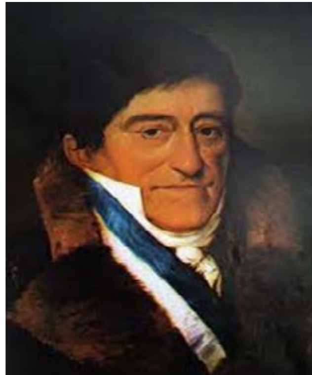
Virrey Juan Ruiz de Apodaca Conde del Venadito

De mayo a julio, autoridades militares y políticas de las principales ciudades del país se pronunciaron a favor del Plan de Iguala, sucesivamente las de Valladolid, Guadalajara y Querétaro cerraron filas con Iturbide. Estos golpes, más políticos que militares, cimbraron la capital virreinal. En opinión de los realistas, el Virrey no