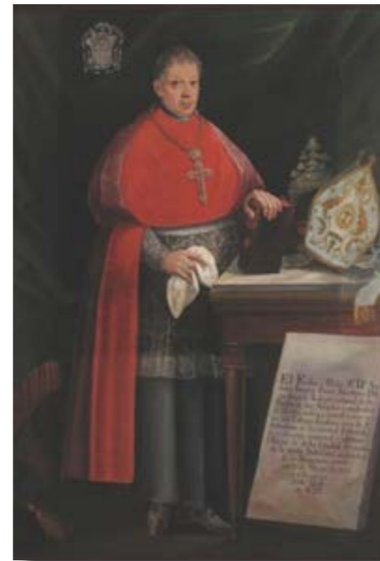
Mosaico alegórico al juramento de la Constitución de Cádiz

Uno de los señalados era el obispo de Puebla, Joaquín Pérez, quien fue, en la Nueva España, el principal "servil" del primer periodo constitucional.