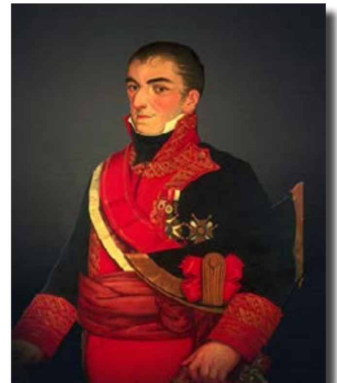
José Ruiz de Apodaca, Conde del Venadito.

Tres años transcurrirán para que las autoridades virreinales lo pusieran nuevamente al mando del Batallón de Celaya. Justo cuando se disponía a salir del país rumbo a España, tras pedir una licencia de dos años; el Virrey, José Ruiz de Apodaca, Conde del Venadito, le encomendó