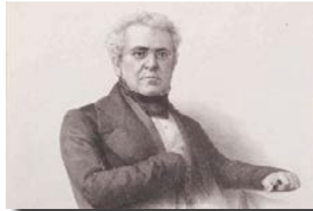
Lucas Alamán padre ideológico del conservadurismo mexicano

¿Cómo recordaron, o recuerdan, a la Madre patria los reaccionarios y en general los mexicanos enamorados del pasado colonial? No podía ser menos que con nostalgia a la manera poética de un Amado Nervo o