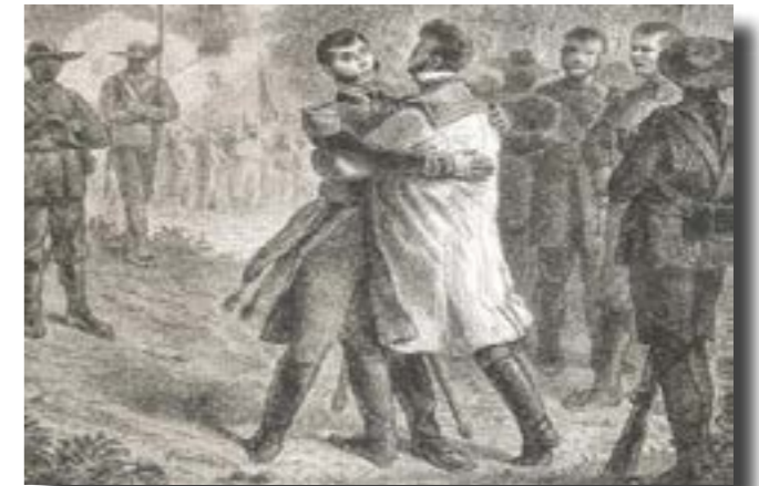
El histórico abrazo de Acatempan que selló la alianza entre Iturbide y Guerrero

El 18 de febrero, Iturbide le comunicó al Virrey que negoció con Guerrero la capitulación de sus guerrillas y que éstas se incorporaron a su ejército. Seis días después, en el pequeño pueblo de Iguala, el libertador plasmó en un documento las