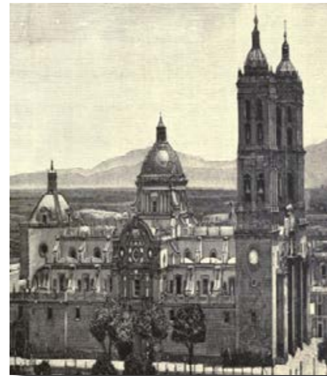
Catedral de Puebla de los Ángeles

El 2 de agosto entró triunfalmente el "Libertador" a Puebla, donde el obispo Joaquín López salió a recibirlo con pompa y platillo. Esta fue una ocasión significativa para el conservadurismo mexicano; la espada y la cruz entrelazadas se